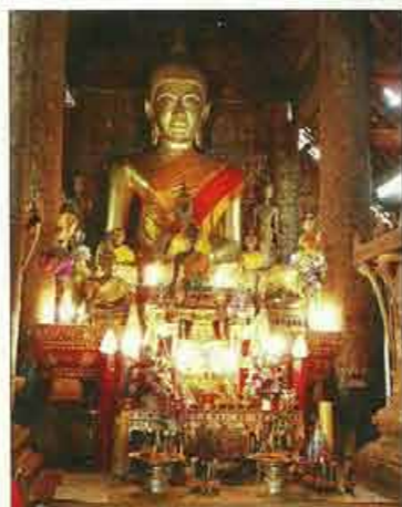
Dans chaque village laotien se trouve un temple bouddhiste

Accroupies sur les trottoirs des ruelles formant le marché Dong Xuan, les fermières, coiffées du traditionnel chapeau conique vendent légumes,