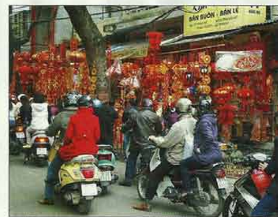
A Hanoi, la préparation de la fête du Têt, le nouvel an chinois, provoque une circulation frénétique dans les rues !