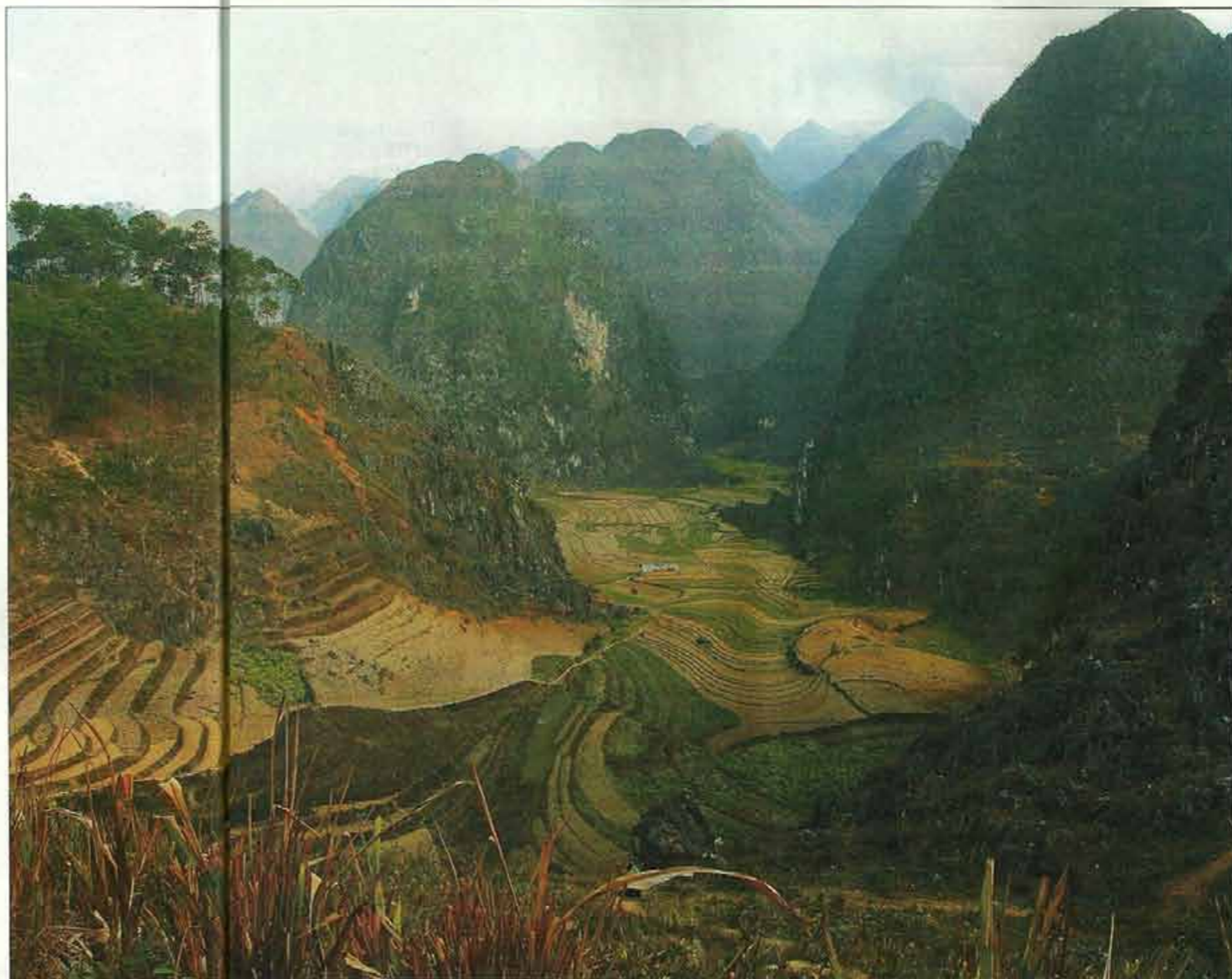
Paysages extraordinaires dans le nord du Vietnam, à la frontière chinoise.