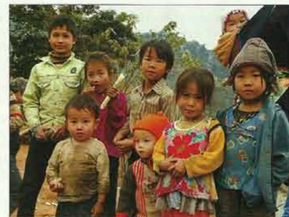
Le raid est l'occasion de rencontrer les nombreuses tribus des montagnes.