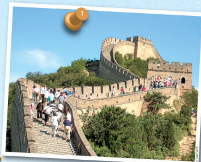
1 La Grande Muraille, symbole incontournable de la Chine.

avançons. Premier contrôle, fouille courtoise des 4x4, puis nous sommes autorisés à descendre vers le poste frontière, beaucoup plus bas. Là, contrôle des passeports, prise de température au cas où nous aurions la grippe A (ouf ! personne n'a de fièvre), relevé des numéros de châssis et... Bienvenue dans l'Empire du Milieu ! Nous immortalisons cet instant mémorable par une photo de groupe avec les officiels et fêtons cette première