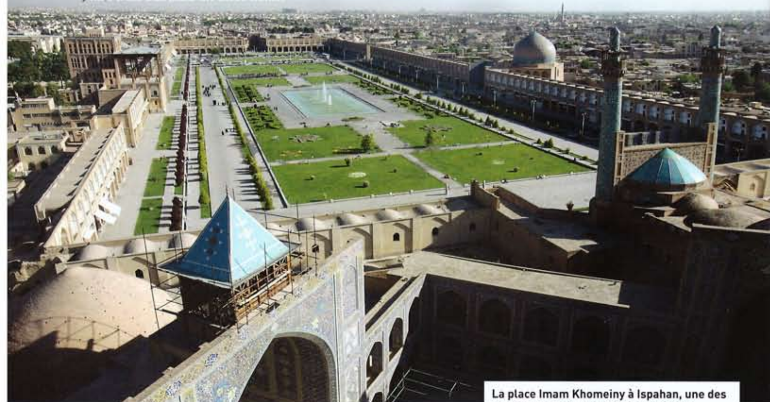
La place Imam Khomeiny à Ispahan, une des plus grandes et plus belles du monde.